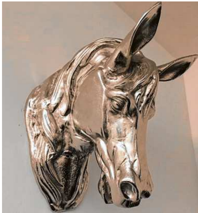
„Roßkopf“-Skulptur im Eingangsbereich.