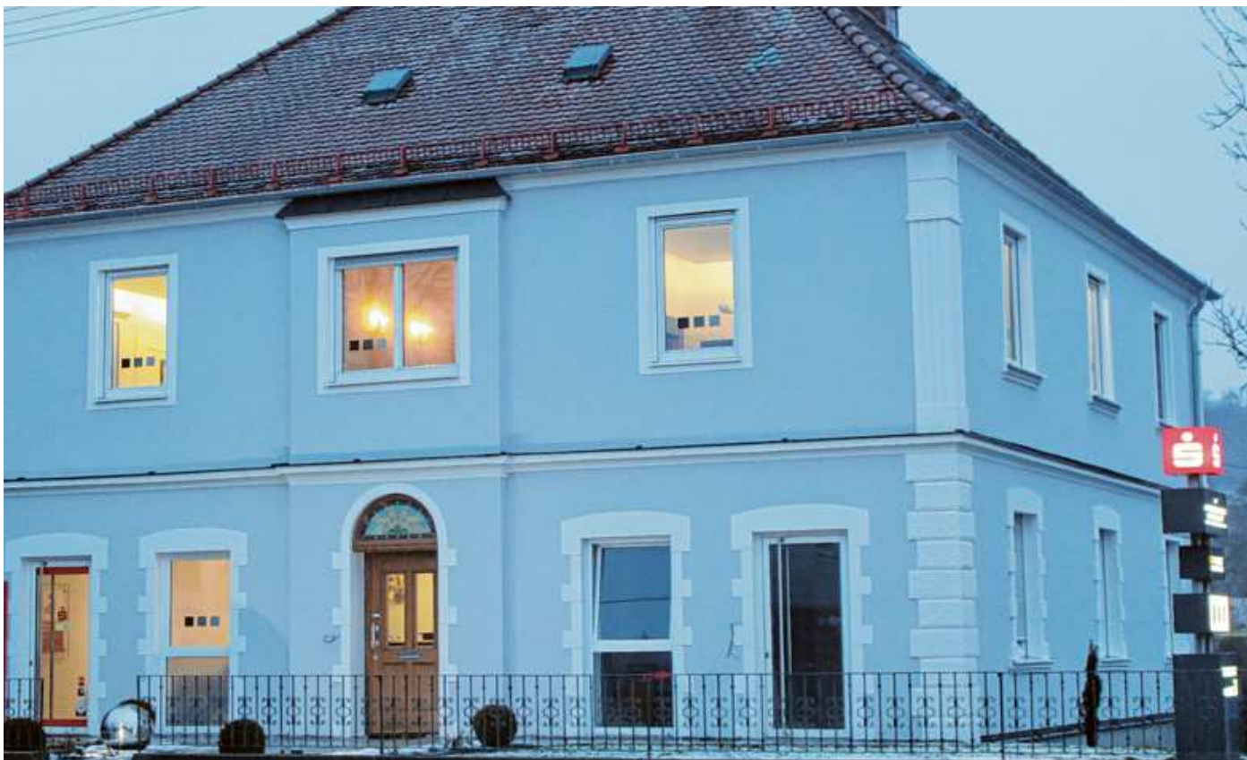
Die ANWALTSKANZLEI DR. ROSSKOPF RECHTSANWALTSGESELLSCHAFT MBH ist ab sofort in einer Vorstadtvilla in der Berger Allee 1 zu finden.