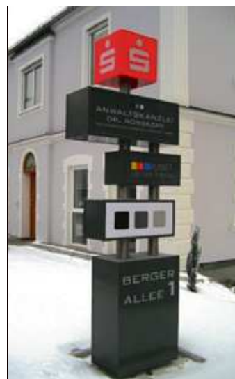
Die gelungene Werbe-Stele wurde von der Firma Fischer-Lichtwerbung aus Oettingen gefertigt und montiert