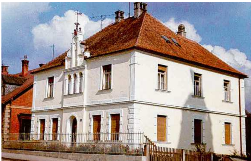
Die Stadtvilla „Berger Allee 1“ hat eine bewegte Geschichte hinter sich. Gut erhalten sind auch noch die Originalpläne der im Jahr 1900 erbauten Villa.